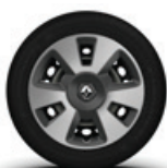
15" keréktárcsák szürke-ezüst dísz tárcsával