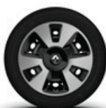
15" keréktárcsák fekete-ezüst dísz tárcsával