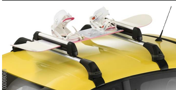
Thule 726 síléc tartó