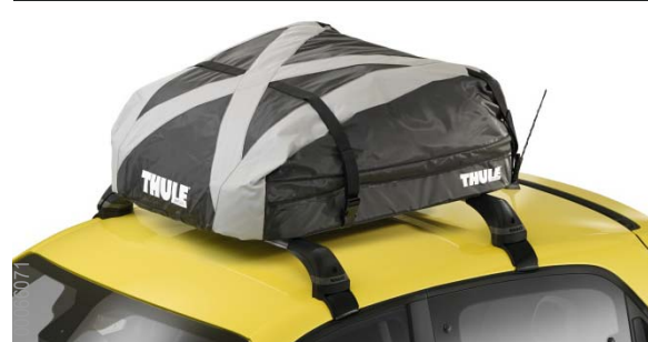
Thule Ranger 90 puha tetőbox

2 pár síléc vagy 2 snowboard szállítására alkalmas, a zárok a kiszerelés részei.